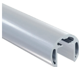
MAIN COURANTE SUPÉRIEURE RONDE