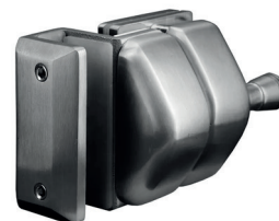
LOQUET MENTONNET VERRE À VERRE AIMANTÉ