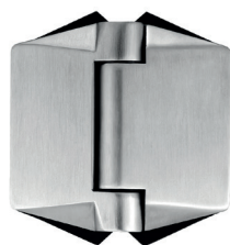
PAIRE DE PENTURES HYDRAULIQUES À RESSORT