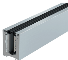
SABOT ACIER INOXYDABLE