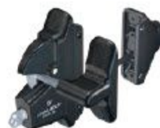
LOQUET MENTONNET 2 CÔTÉS