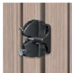
LOQUET 1 CÔTÉ