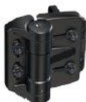
CHARNIÈRE À RESSORT