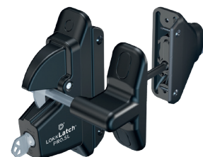
LOQUET MENTONNET 2 CÔTÉS