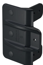
ARRÊT DE BARRIÈRE