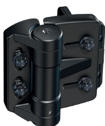
CHARNIÈRE À RESSORT